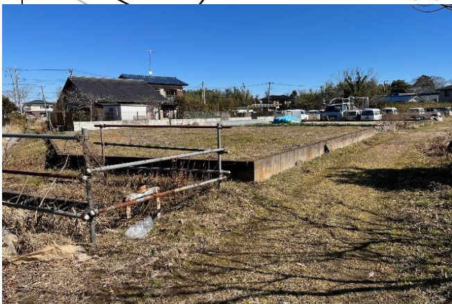
①南西側から敷地内