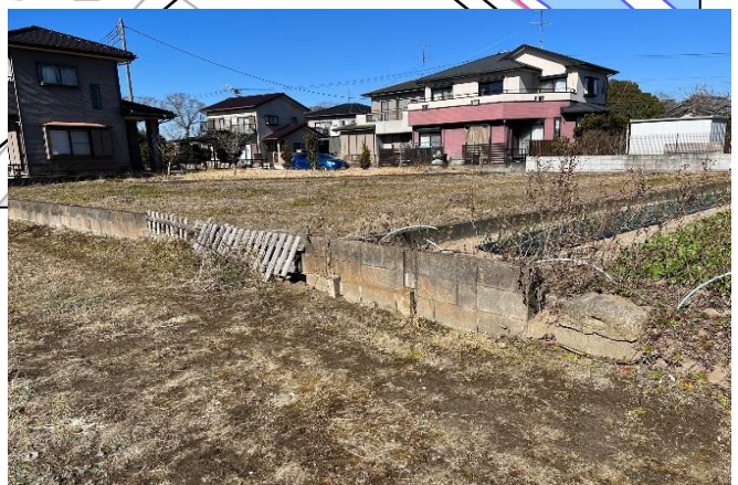
②南東側から敷地内