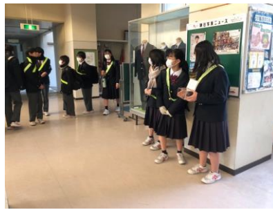
登校時刻に合わせて募金活動をする委員

「少しでも能登半島地震で被害を受けた方々の役に立てたら」という願いのもと、福祉委員会が中心となり、支援募金活動が行われました。城ノ内中の気持ちが1つとなった総額15,620円は、市社会福祉協議会を通じて石川県に送られます。