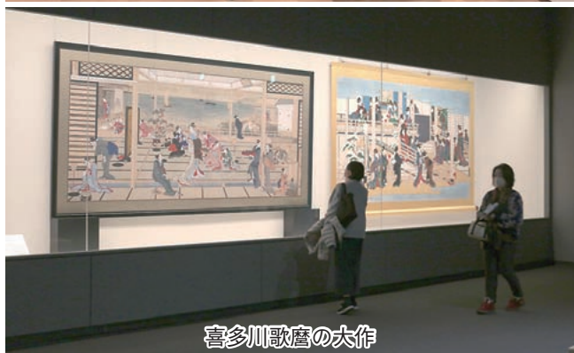
喜多川歌麿の大作