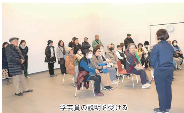
学芸員の説明を受ける

美術館視察後には、歴史的な建造物が残り「蔵の街」として知られる街並みや舟による交易が盛んであった巴波川（うずまがわ）を散策するなど、有意義な研修となりました。