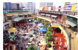
賑わいをつくる 15年

そして、時代や趣向の変化に影響を受けやすくなるのは商業を軸とした「賑わい」です。ネット社会の到来で商業にまつわる条件は日に日に変化し、15年先の賑わいでも予測が困難な状況が今の時代です。そうした大きなうねりに対応できるように施