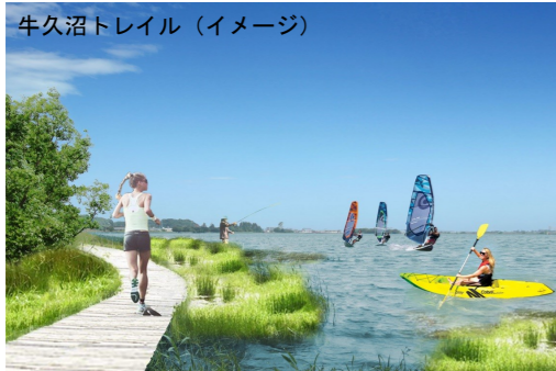
牛久沼トレイル (イメージ)