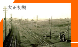
自然環境をつくる 100年

■サンフランシスコ ベイトレイル■ サンフランシスコ湾を一周する、自転車と歩行者のトレイルコース。1986年にアイデアができ、今後はさらに延伸し、47の都市と9つの郡の海岸線を結ぶ計画が進行中。