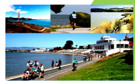
道・広場をつくる 50年

■サンストリート亀戸■ 広場では定期的にイベントが開催されたり、子どものための遊び場が設置され、ものを買う人も買わない人も思い思いに集い、時間を過ごすことができる居場所となった。