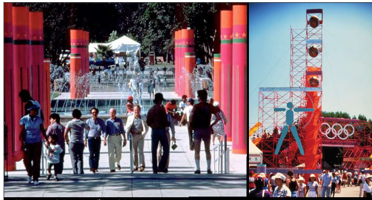
税金を使わず開催した 仮設可変のオリンピック 1984 Los Angeles Olympics