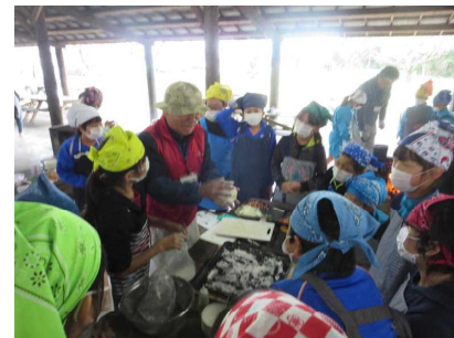
ピザづくりをする子どもたち

大宮小の5年生のみなさんと協力しながら、ウォークラリー、キャンプファイヤー、ピザづくり、そして奉仕活動など充実した活動を行うことができました。特に印象に残ったことは、それぞれの活動において、自ら気づきそして率先して活動することができていたことです。成長の足跡が随所に見られ、とても嬉しく感じました。