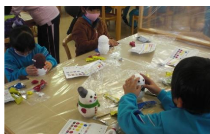
紙粘土で貯金箱を作りました。

昨年12月2日(木)に1, 2年生がバス遠足で、こもれび森のイバライドへ行きました。創作活動や動物との触れ合い体験等に元気いっぱいに取り組むことができました。遠足を通して、めあてである「友達と仲良くしよう」「決まりを守って楽しく遊ぼう」を見事に達成することができました。(本校HP学校生活「1, 2年生バス遠足を実施」もご参照願います。)