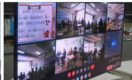
「一年の計は元旦にあり」リモートによる集会でしたが、各クラスでしっかりと話を聞くことができました。