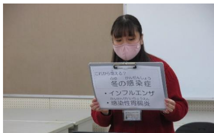
保健室の先生から、感染症予防についての話がありました。

1月7日(金)から、2022年の学校生活がスタートしました。新しい年を迎え、子ども達も新たな気持ちになっていると思います。1月7日の朝の時間を利用して冬休み明け集会を実施し、その中で「一年の計は元旦にあり」という話をしました。物事は初めが大切であり、計画的に進めることが必要になります。今、子ども達が抱いている夢や希望の実現を目指して、元気いっぱい学校生活を送っていくことを大いに楽しみにしています。