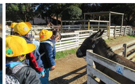
動物の大きさにびっくり!