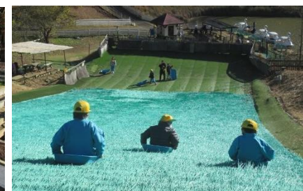
芝すべりはみんなに大人気!