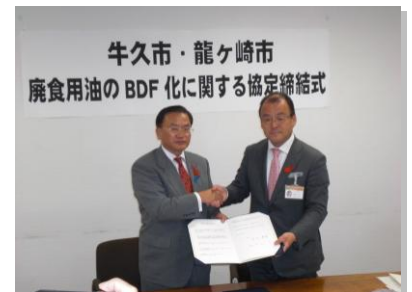
牛久市と廃食用油のBDF化に関する協定締結

バイオディーゼル燃料化事業の開始に伴い、これまでの各公民館に加えて、「サンデーリサイクル」でも廃食用油の回収を始めました。ご協力をお願いします。