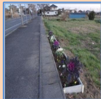
西小通学路沿いに花壇整備を試作 （環境美化委員会）

これらの取り組みを通じて、将来的には龍ヶ崎西地区防災マップの作成や高齢者の居場所づくりの検討などを行い、地域の安全・安心がこれまで以上に向上する活動を行う予定です。