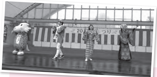
みんなで楽しく踊ったよ〜ん！ —桜まつり・龍ヶ岡公園—

このコーナーでは、街で見かけたまいりゅうの目撃情報や、あなたの撮ったまいりゅうの写真、まいりゅうのイラストなどを募集します。コメントを添えて、りゅうぼー編集室「まいりゅうを探せ」係 (☒ = koho@city.ryugasaki.ibaraki.jp) までお寄せください。