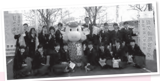
みんなで安全運転のお願いしたよ〜ん！ —交通安全街頭キャンペーン・文化会館前—