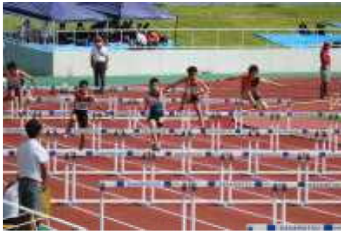
1年男子100mH 第8位入賞 おめでとうございます!

10/1(土)大宮小の運動会のお手伝いに行ってきました。今回のメンバーは積極的にエントリーしてくれました。母校への恩返し&地域の方に貢献できたかな。