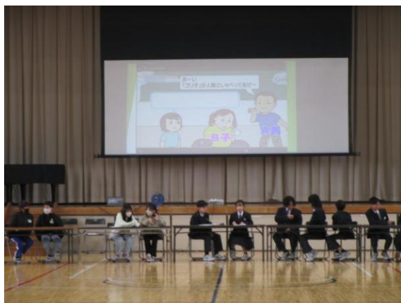
<リーフリボンフォーラム>