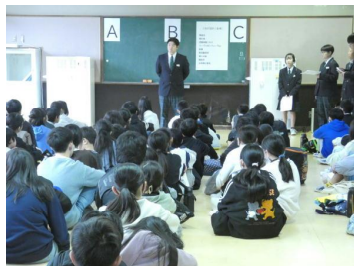
*生徒会役員の運営は 素晴らしかったです