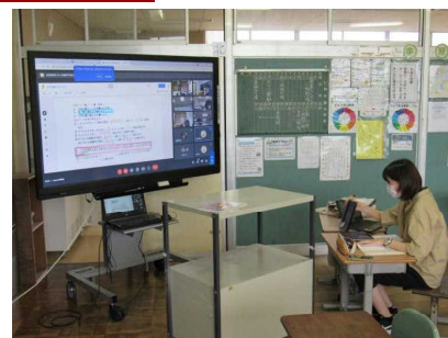
3年生リモート学習の様子

さて、感染者数は減少してきていますが、毎日の感染症対策はこれまで以上に努めていくことが大切です。各ご家庭におかれましても、「ゼロ密」「マスク」「手洗い・消毒」の励行にご協力をお願いします。