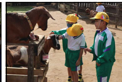
【動物との触れ合い】