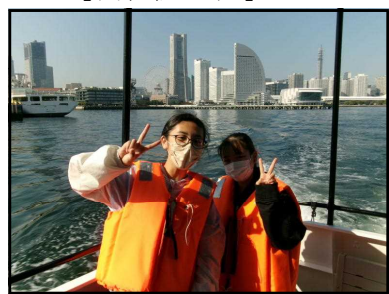
【横浜港クルージング】