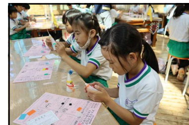
【キャンドルづくり】

10月17日（火）に2年生は、アンデルセン公園に遠足に行きました。ハッピーキャンドルづくりやアスレチック、動物との触れ合い体験などを行いました。