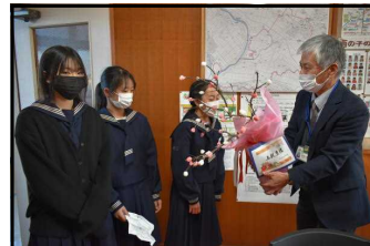
↑城南中学校様から

今年も、城南中学校様と北文間コミュニティ協議会様から、本校に「ならせ餅」が寄贈されました。「ならせ餅」とは、紅白の餅を木の枝に刺して、無病息災や五穀豊穡を祈願する伝統行事です。1日も早くコロナが収束するよう、願いを込めて職員玄関に飾らせていただきました。今年も、実り多き年にしていきたいと思っております。 ←北文間コミュニティ協議会様から