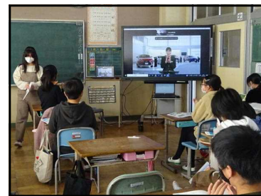
説明を聞きながら学習する5年生