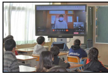
集会を視聴する児童

新型コロナウイルス感染症拡大を防止するため、1月31日(月)～2月20日(日)の間、長いリモート学習期間となりました。リモート学習期間中の時間割は、毎日5時間。各学年では、様々な工夫を凝らしながら、リモートを使った授業の工夫をしていました。画面を通して、ラジオ体操の練習をしたり、画面に映る友だちの指先を見ながら、鍵盤ハーモニカの演奏を練習したり、児童のノートをチェックしてメッセージを書いたり、どの学年も双方向のやりとりをしながら、リモート学習の充実を図っていました。