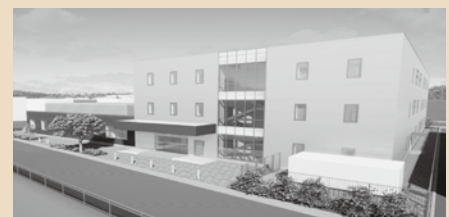
▲新保健福祉施設イメージ