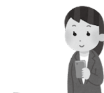
▲スマートフォン等を用いて申請が可能に

り出産育児一時金の額が引き上げられることから、本条例で定める出産育児一時金の額について、同様の改正を行うものです。 ◆議案第15号 龍ヶ崎市印鑑条例の一部を改正する条例について 印鑑証明書の交付申請手続について、スマートフォン等を用いた申請が可能となるよう、所要の改正を行うものです。 ◆議案第16号 龍ヶ崎市と茨城県信用保証協会との損失補償金寄託契約に基づく回収金の返還を受ける権利の放棄に関する条例の一部を改正する条例について 本条例に基づき、中小企業等の事業の再生の促進を目的に、市が茨城県信用保証協会に対し損失補償を行った場合に生じる回収金の返還を受ける権利の放棄に関し、その条件となる事項に係る根拠法令について、法律の制定、廃止に伴う修正を行い、新たに対象となる計画の追加を行うため、改正を行うものです。