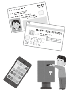
▲オンラインや郵送での申請も行っています

また、直近3か月の申請件数は、令和4年11月に2419件、同年12月に4274件、令和5年1月に1746件となっております。