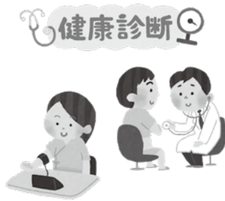
▲特定の年齢に達する方の健康診査費用を無料とします

健康診査の受診を促進し、がんの早期発見や正しい健康意識の普及を目的として、その年度において特定の年齢に達する方に対して、がん検診、特定健康診査等に係る費用を無料とするため、本条例を制定するものです。