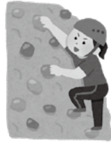
▲スポーツクライミングの聖地を目指す切った期待！

大会後も交流関係のできた国との友好関係を深める等、未来に向けた積極的取り組みを！