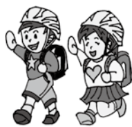
▲通学用ヘルメットの配布を

議員 毎年、危険箇所を吸い上げ改善しています。が、通学路によっては危険箇所と感じていても解決が難しい幅員の狭い通学路があります。何かがおきてからでは困ります。可能性がゼロでないのであれば対策すべきです。歩道のない生活道路や通学路の狭い場所にペイントをするグリーンベルトがあります。こちらも含め、幅員の狭い通学路に対する安全対策について伺います。