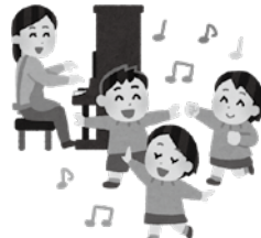
▲本年10月1日より幼児教育・保育が無償化

施設等利用給付」の制度が創設されることに伴い、国の定める「特定教育・保育施設及び特定地域型保育事業の運営に関する基準」が改正されたことから、本条例についても、当該国の基準に準じ、改正を行おうとするものです。