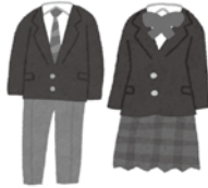
▲制服選択制の導入を

教育部長 冬の防寒対策や機能面、また、男女の性差にとらわれない多様な性を尊重し合う観点から、今後検討していきたい。