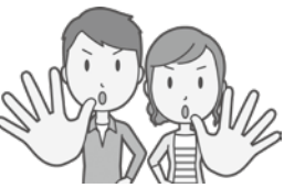
▲道の駅は「勇気ある撤退」を

議員 商業施設の利用客の1%、2%の人が道の駅に足を延ばしてくれるのではなく、道の駅の利用客の50%、60%の人が桑原地区の商業施設に持っていかれてしまう。68ヘクタールの桑原地区の商業施設は、1日あるいは何日でも楽しめる。道の駅の開業時期については、当初2019年の茨城国体開催、2020年の東京オリンピック開催に向けて、間に合わせるわけが間に合わず。大幅に遅れている。未だ、「魅力ある牛久沼」、「魅力ある道の駅」が出来ず。桑原地区の商業施設も出現する中で、市長決断で勇気ある撤退、勇気ある見直しを求めます。