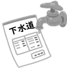
▲令和2年4月1日より下水道使用料が改定

地方公営企業法の適用に伴い、下水道事業のより一層の独立採算性が求められるとともに、今後の施設の老朽化等に対応し、使用者間の公平性を確保するため、消費税率改定に伴う場合を除き、平成16年度以降据え置きとなっている使用料について、見直しを行おうとするものです。