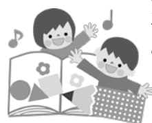
▲子どもたちの未来のために

教育長 児童・生徒を取り巻く課題が複雑化・多様化する中で、単に教員数を増やすだけではなく、チーム学校では学校の組織力を一層充実させるために専門的な知見を持ち、児童・生徒に一層効果的な指導・助言が行える専門スタッフの効果的な配置など、人員体制