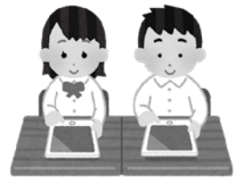
▲コロナ禍でより需要が見込まれるGIGAスクール