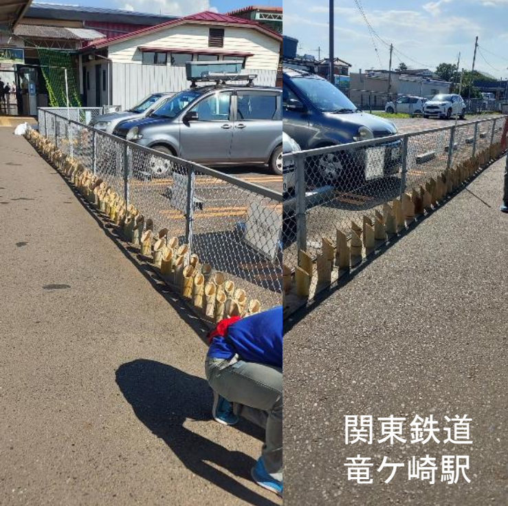
関東鉄道 竜ヶ崎駅