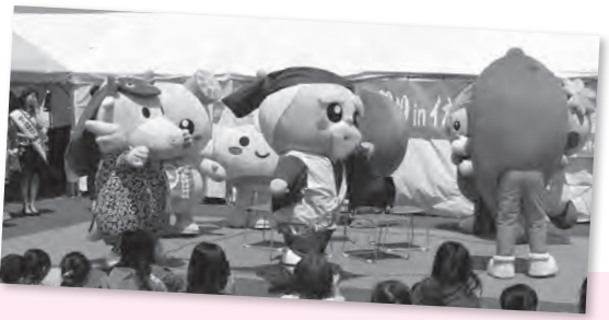
ゆるキャラのみんなとイス取りゲームをしたよ〜ん! -いばキャラ祭り in イオンタウン水戸南-

このコーナーでは、街で見かけたまいりゅうの目撃情報や、あなたの撮ったまいりゅうの写真、まいりゅうのイラストなどを募集します。コメントを添えて、りゅうほー編集室「まいりゅうを探せ」係 (☒ = koho@city.ryugasaki.ibaraki.jp) までお寄せください。