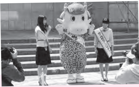
観光アンバサダーと観光PRしてきたよ〜ん! - AIRPORT MARKET 空市 -