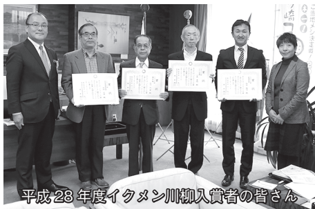
平成28年度イクメン川柳入賞者の皆さん

多くの方々に男女共同参画を身近なものとして考えていただくために、男性の子育て「イクメン・イクジイ」をテーマとする川柳を募集しました。幅広い年齢層から応募があり、219人が345句が寄せられました。入賞作品は市公式ホームページに掲載しています。