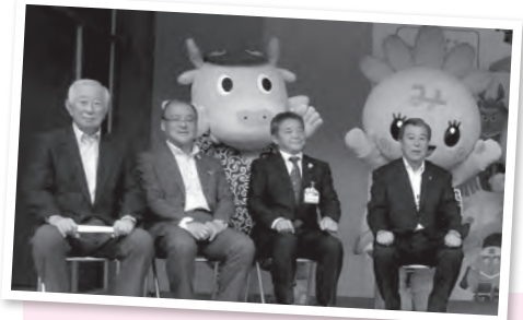
龍ヶ崎市をPRしてきたよ〜ん！ —全国コロッセフェスティバル 静岡県三島市—

このコーナーでは、街で見かけたまいりゅうの目撃情報や、あなたの撮ったまいりゅうの写真、まいりゅうのイラストなどを募集します。コメントを添えて、りゅうぼー編集室「まいりゅうを探せ」係 (☒ = koho@city.ryugasaki.ibaraki.jp) までお寄せください。