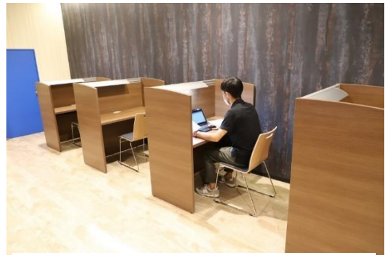
▲テレワークスペース