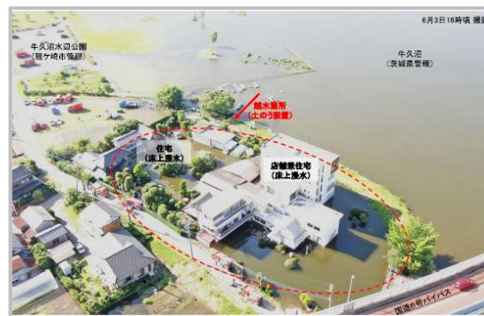
越水① 龍ヶ崎市稗柄町