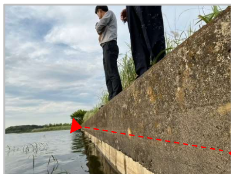
道の駅整備予定地 牛久沼の水位は赤の 破線まで来ていた。