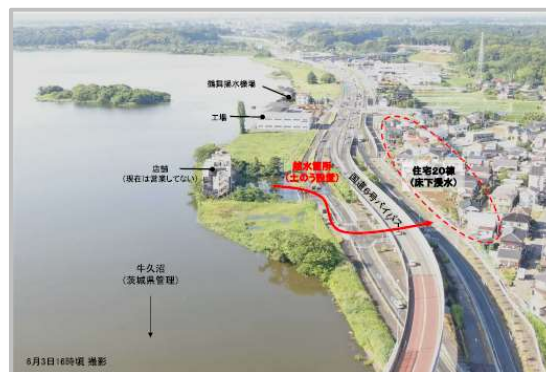
越水② 龍ヶ崎市佐貫町