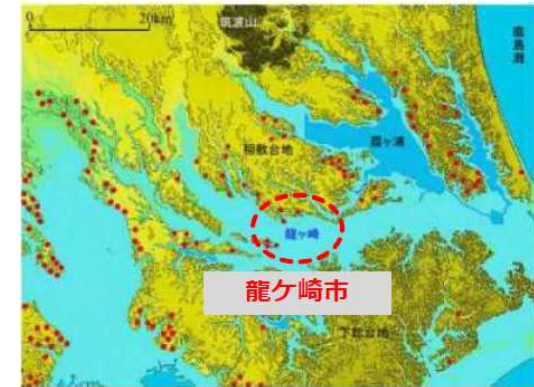
約6千年前（縄文前期）の関東平野