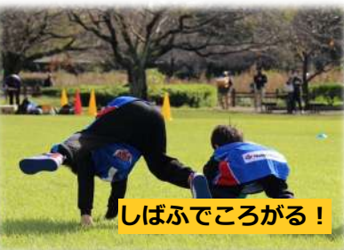
しばふでころがる！