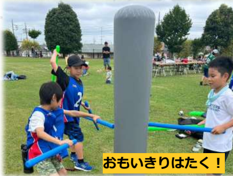
おもいきりはたく！