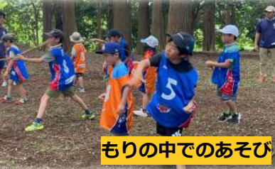
もりの中でのあそび