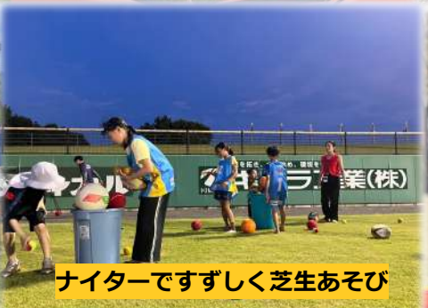
ナイターですずしく芝生あそび