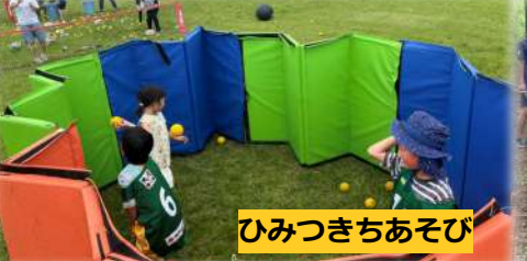
ひみつきちあそび