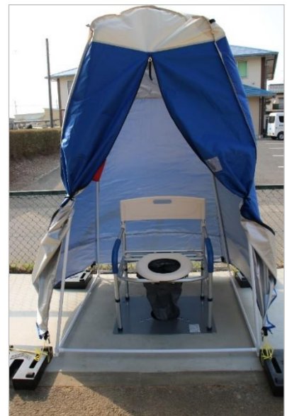
▲ 八原小に設置されたマンホールトイレ