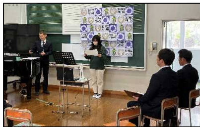
始業式で抱負を述べる6年生