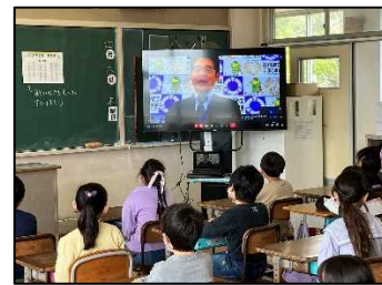
Live 配信による校長先生の話

7日には、入学式が行われました。在校生として6年生が参加し、保護者や来賓に見守られ、新入生102名が八原小学校に入学しました。新入生呼名での返事や進行の声かけに合わせた動きを見ると、八原小学校での生活や学習に頑張ろうとする意欲を感じました。