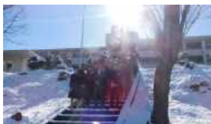
「校長先生と雪集合写真」