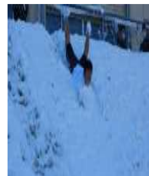
「雪上だダイブ」 ■■さん