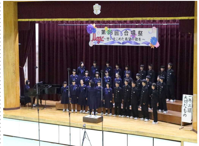
3組 ♪ 大切なもの♪

ほくは、はじめての合唱祭を経験して思ったことがあります。それは、必死に練習することが大切だということです。自分たちが歌ったのは、小学校の卒業式と同じ曲でした。だから、あまり練習しなくても大丈夫だと思って、ふざけて練習している人がいました。そのせいで、なかなか練習がうまくいかないまま本番をむかえてしまいました。ほくたちは、1番に歌うクラスだったので、少し緊張してしまい、いつもより声が出ませんでした。ですが、他のクラスや先輩方は、練習の時よりも良い歌だったように聴こえました。ほくたちのようにふざけて練習していたクラスとはちがって、真面目に練習していたクラスは、その分、良い合唱ができたのだと思います。そして、3年生が全力で歌っている姿から、体育祭と同じように、中学校最後の大きな行事にかけている思いの大きさが、すごく伝わってきました。だから、次の合唱祭には練習より良い歌が歌えるように、しっかり練習したいです。これからの中学校生活で大きな行事1つ1つに全力で臨めるように先輩方を見習っていきたいです。