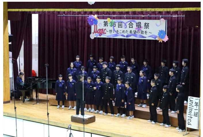
1組 ♪ unlimited ♪

いろいろあったけど、「いけるかも?」と思えるぐらいの仕上がりにになりました。そして本番...優秀賞。1組最高。努力は実るんだね。