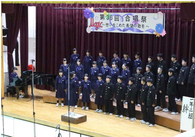
2組 ♪ 絆 ♪

合唱祭当日、最後の朝練をして、のどを整えて合唱に臨んだ。自分のクラスの番になると、たくさんの方が注目していて少し緊張もあったけれど、全力で歌うことができた。結果発表では賞が取れなかったけど、楽しく歌うことができてよかった。吹奏楽部の演奏も失敗せずに終わることができた。今年は合唱で賞を取ることはできなかったから、来年はもっと練習して賞を取りたい。