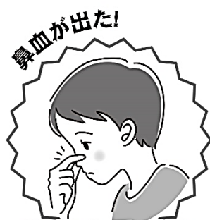
鼻血が出た！ 軽くうつつむいて、親指と人差し指で鼻をつまむ