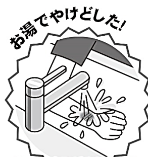
お湯でやけどした！ 流水で痛みがやわらぐまで冷やす

授業で火や熱いものを扱ったときや、家でヘアアイロンを使ったときに、やけどをしてしまったと言って保健室に来る人がいます。きちんと流水で冷やしてから来る人もいれば、昨日やけどしたけれど、冷やしてないです…という人も。やけどをできるだけ軽症化するためにはすぐに冷やし始めることが大切です。