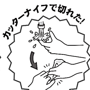
カッターナイフで切れた！ 流水で傷口を洗い、清潔なハンカチなどで止血