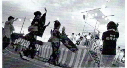
櫓回りの踊りの様子