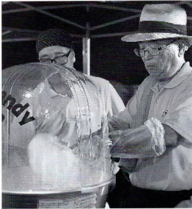
↑「綿あめづくり初挑戦！」