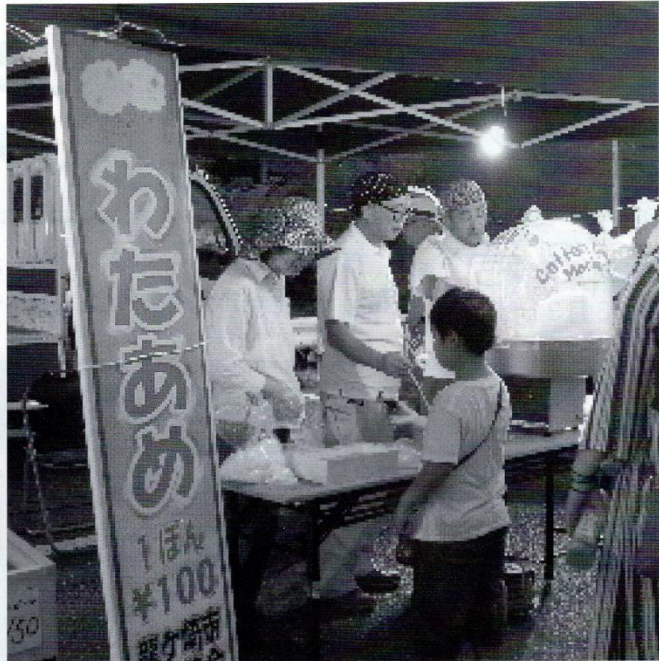
綿あめ店「もうちょっと待ってね」→