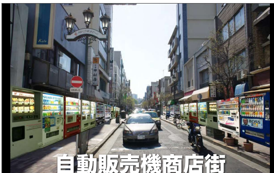
自動販売機商店街