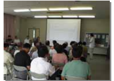
ごみダイエットキャラバンの様子

今回は、「ごみダイエットキャラバン」において、参加者の皆さんからいただいた代表的なご質問の内容とその回答をご紹介します。