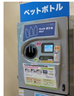
(ペットボトル回収機)