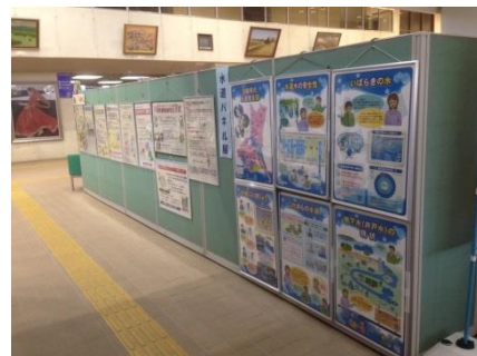
(パネル展示の様子)