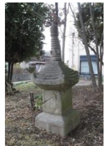
宝篋印塔（伝平国香供養塔）

また、文化財のパンフレットを作成し、文化財の保存と継承のための啓発活動を行っています。