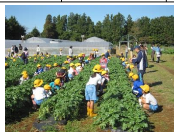
(収穫作業の様子 左：保育所園児、右：小学生)