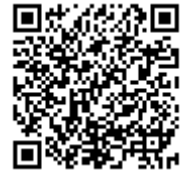
(もったいない情報板のQRコード)

なお、フェイスブック上に「龍ヶ崎市もったいない情報板」を開設し、利便性の向上に努めています。