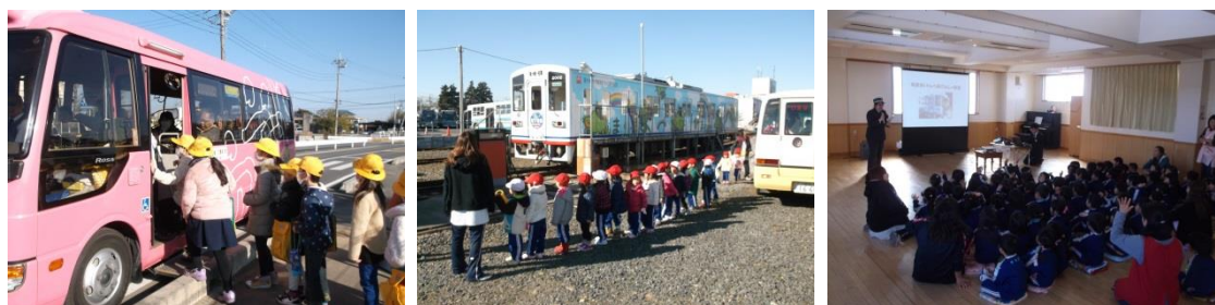
(モビリティ・マネジメントの様子)