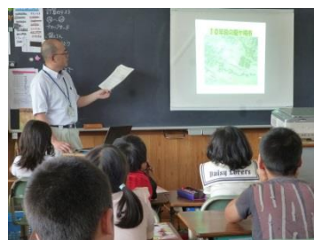
(城ノ内小学校の様子)

環境問題への関心を高めるため、小学生(4年生から6年生)及び中学生を対象として、小中学校などからの要請に応じて「こども環境教室」を開催しています。講座の内容は、「龍ヶ崎市の自然環境」や「ごみ・リサイクル」など、パワーポイントを活用しながらの講座やこどもたちが体験できる「水質検査」の講座などを希望に応じて行っています。