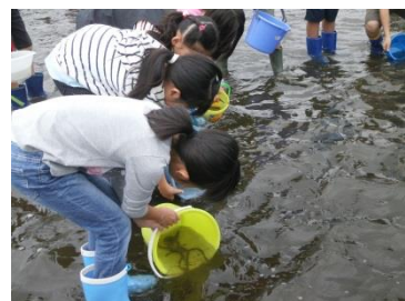
(稚魚の放流の様子)