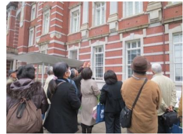
(見学ツアーの様子)