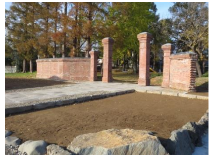
(移築後の赤レンガ門)

市は移築場所の貸出し、補助金交付のほか、移築後の赤レンガ門周辺の整備等の支援協力を行いました。