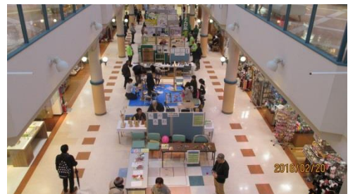
（市民活動フェアの様子）