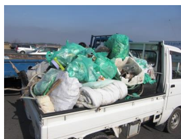
(市内一斉清掃の様子)