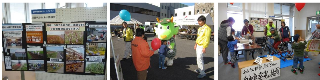
(環境フェア出展の様子)