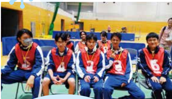
ボッチャ交流会 11/29 (土)