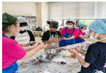
「さかな丸ごと食育教室（小学5・6年生対象）」の様子

これからも、おいしくて、時短で、安く、健康を考えた料理の提案をボランティア活動を通して実施して行けたらと思っています。