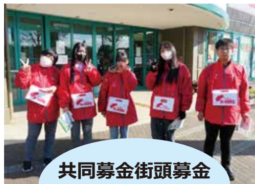
共同募金街頭募金 12/6 (土)