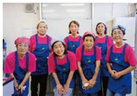
アミューズ会員。みんな料理が大好きです。