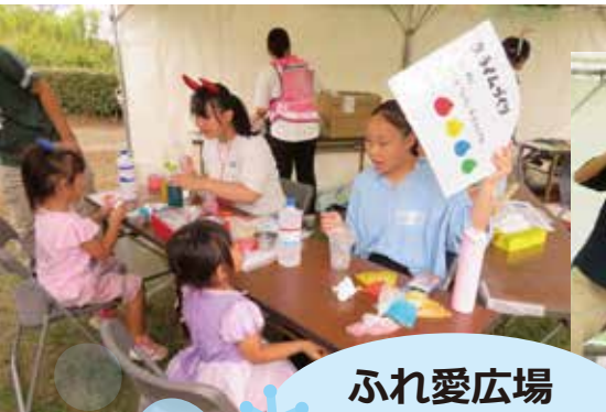
ふれ愛広場 10/4 (土)