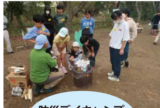
防災デイキャンプ 10/19 (日)