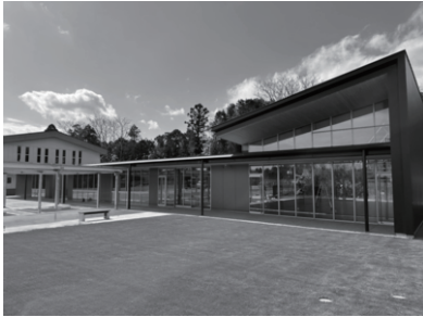
▲新長戸コミュニティセンターが、令和8年4月19日にオープンしました。多目的室や調理室、芝生広場などがあります

審議された主な議案の内容と、本会議で行われた議案に対する質疑や討論の一部について掲載しています。議案を所管する委員会においても、議案等の審査を行っており、その審査内容の一部を次ページに掲載しています。