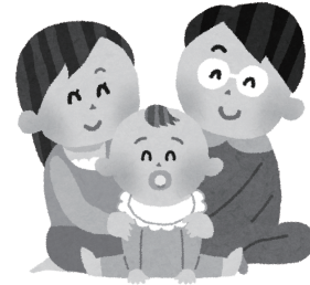
▲令和8年度より「こども未来部」が設置されました

◆議案第8号 龍ヶ崎市コミュニティセンターの設置及び管理に関する条例の一部を改正する条例について