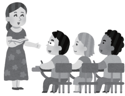
▲多文化共生を支える教育現場に対する支援を

教育監 担任等教職員個人の努力のみに委ねるのではなく、組織的な支援体制の下で対応し、持続可能な指導体制を構築しています。具体的には、