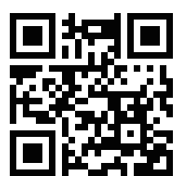
X (旧 Twitter)