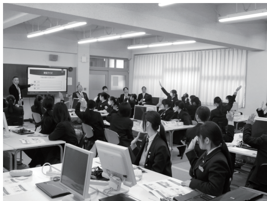
▲議会の仕組みや議員活動について説明した後、議会クイズを行い、楽しみながら理解を深めていただきました

若い世代ならではの視点から、まちに求める魅力や居心地の良さにつながる多くのヒントを得る、貴重な機会となりました。