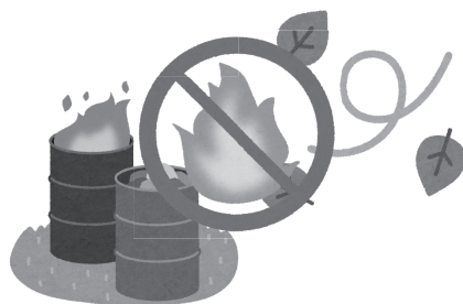
▲林野火災警報に従わなかった場合罰則を適用される可能性があります

また、注意報違反に対する罰則はありませんが、警報違反の場合は30万円以下の罰金または拘留となります。