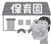
▲「こども誰でも通園制度」は、令和8年4月1日から本格的に開始しました

福祉部次長 通常保育が必要なお子さんが増えた場合には、こども誰でも通園制度の利用枠を減らし、通常保育を優先していくような形での運営を予定しております。