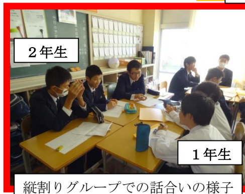
縦割りグループでの話し合いの様子