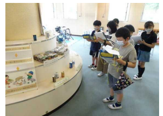
4年クリーンプラザ見学