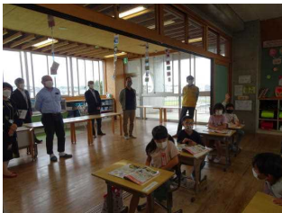
学校評議委員会開催