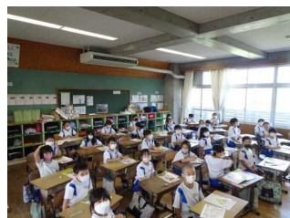
2年は姿勢が良いですね