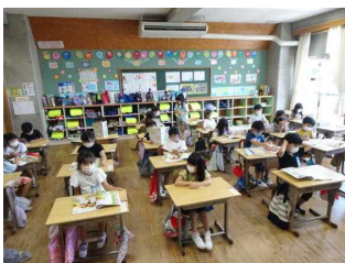
1年は真剣にお勉強