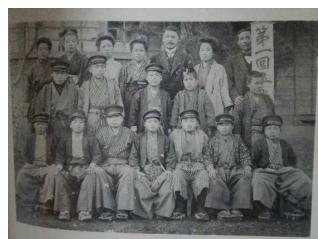
馴柴小第1回卒業生