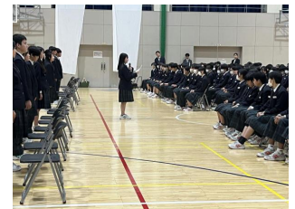
3年生代表あいさつ