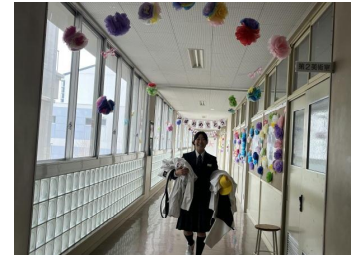
装飾作成実行委員の作品