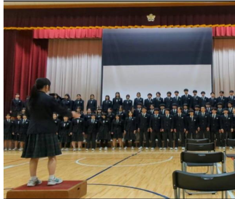
3年生から合唱のプレゼント