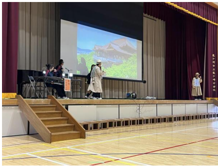
スキット実行委員の発表

1・2年生が「スキット作成」と「装飾作成」の2つの実行委員を立ち上げ、計画・準備をしてきました。「スキット作成」は、3年生のアンケート結果を参考に、学校生活を寸劇で振り返る発表を行い、「装飾作成」は、会場や廊下など思い出を振り返ることのできる素敵な飾り付けを行い、子ども達の主体的な活動がたくさん見られました。お世話になった3年生への感謝の気持ちが詰まった温かい送る会になりました。