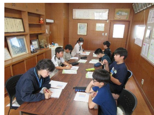
委員長会議のようす