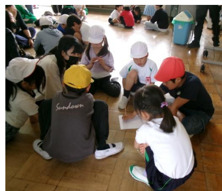
縦割り班スタート会議のようす

4月14日からは、今年度の委員会活動も本格的に始まっています。5月20日には各委員会の委員長が集まって会議を行いました。会議では「これから西小をより良くするために、自分たちの委員会に何が出来るか」を一人ひとりが真剣に考え、熱心な意見交換が行われました。自ら進んで学校を動かそうとする頼もしい姿が見られました。この「縦割り活動」と「委員会活動」という大きな柱を通して、高学年が学校の「頼もしいリーダー」へと成長していく姿を、温かく見守っていただければ幸いです。