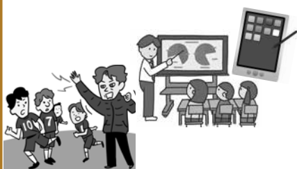
▲教師と子どもが自由な時間を取り戻すための取組

議員 教育ICTも、部活動の地域移行も教員の働き方改革の本質は、教師と子どもが自由な時間を取り戻すために行うべきものです。