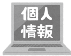
▲適正な制度運用に向けた準備を進めていきます

また、広報紙においても条例施行前の2月を目途に掲載し、市民の皆様へ周知したいと考えております。