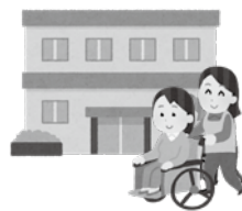
▲障がい者の方が利用するグループホームが増加

直近1年間の新たに開設された事業所のうち、小通幸谷町のグループホームがございませう。こちらは、特に重度の知的障がいや身体障がいに対応するグループホームとして設置されております。介護者が高齢になったことにより、在宅で生活されていた重度障がい者の方々がグループホームに入居されております。