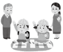
▲保護者が安心できる子育て環境の強化を

例の認識をしております。本年度は学校と保護者の連携アプリを導入し、利用が浸透してきている状況であります。登下校の安全対策を補完するICTタグについては、一定の効果が期待できますが、費用対効果の検証が必要と考え、現時点では保護者、地域の方の見守り活動を継続していきたいと考えます。