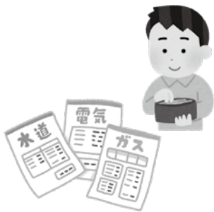
▲家計急変世帯などに対して給付金を支給