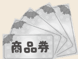
▲プレミアム付商品券を販売