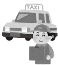
▲アフターコロナを見据えた仕組みづくりを！

議員 アフターコロナを見据え、疲弊した事業者を立て直す街づくりの仕組みは、今のうちに考えねばなりません。中長期的な展望を持ち、持続性ある様々な仕組みづくり、やり方について、今後継続的に検討していただくことを要望します。