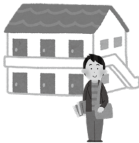
▲対象の大学生は給付金が受け取れます