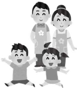
▲保育士、学童保育業務従事者等を支援

教育部長 学童保育ルーム従事者応援事業は、本年4月から5月の学童保育利用自粛要請期間中から継続して、本市の学童保育業務に従事している支援員及び支援補助員を対象とし、従事した月数に応じ、1人1ヶ月当たり1万円を支給するもので、対象者数は109名です。 支給方法は、保育ルームの運営受託事業者から一括して、補助金を申請していただき、当該事業者を経由して対象者に支給する予定です。