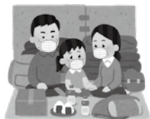
▲複合災害時には3密を 防いだ避難所運営を！

危機管理監 当市では、龍ヶ崎市避難所運営マニュアルを基本とし、国から示された新型コロナウィルスの感染症対策を踏まえた避難所開設する為の手順、3密にならない避難所レイアウトを検討し、有事の際にはそれらを講じた避難所運営が出来るよう、協議を行なっています。 議員 複合災害が起きる前に、市民への周知を徹底していただく為の方策はどのようにお考えですか。