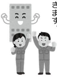
▲地域経済活性化に向けた対策を！

議員 来年度以降、自主財源が減少する中、新しい生活様式に対応した「新しいビジネスモデル」、コロナと共生し経済を活性化させる今後の方針を伺います。 市長 地域経済活性化は、感染状況のステージに応じた取組みで、経済を循環させ回復軌道に乗せることが重要で、感染症対策の新しい生活様式を徹底し第2波に備え、しっかりとシミュレーションし、ご指摘の経済、コロナ対策の施策は効果的な取り組みを躊躇することなく積極的に講じていきます。