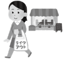
▲出前やテイクアウトで市内の飲食店を応援