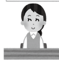
▲持続化給付金制度の対象外の方を支援