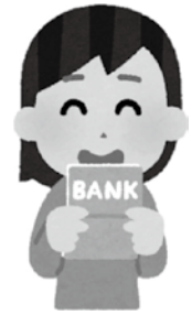
▲特別定額給付金が給付されています