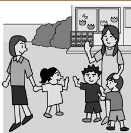
▲通える環境作りを