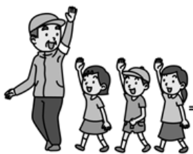
▲気を付けて渡ろう

議員 市内警察署から消防署方面に向かい、接骨院とマンションがある、下町と砂町にまたがる信号機の無い交差点で、事故が増えています。信号機設置の要望は毎年行っていますが、事故防止のため、ポランテアでできる看板設置を考えています。許可等が必要ですか。 市民生活部長 一般的に看板を設置する場合は、屋外広告物として扱われますが、自治会や子ども会等が自主的に交通安全の看板を設置したいという場合には、交通防犯課にご相談いただければ、必要な手続等を一緒に検討しますので、お気軽に問合せ下さい。