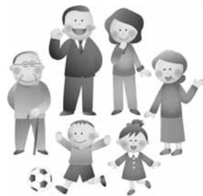
▲成長に合わせた取り組みを

ことでワンストップのサービスができるよう運用面で工夫に努めているところで、今後更なるサービス向上に努めてまいります。