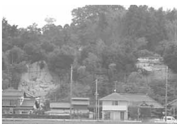
▲崩壊現場箇所の現況

当市においても、ほとんど民有地上で施行される工事であり昨年、当市において急傾斜地崩壊対策事業分