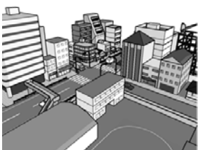
▲中心市街地の活性化を

議員 本年12月までに策定される、まち・ひと・しごと創生総合戦略に位置づけをしていくべきと考えますが、具体的な取り組みや構想があればお示しください。 市長 自動車利用の利便性を考慮した、街なかの駐車場整備を考えております。また、市有地であるにぎわい広場や中央公園周辺を有効活用しながら、情報発信やイベント・地