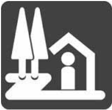
▲道の駅の標識です

り、結果、向上意欲の薄さから経営に行き詰まる事例が多い。この辺の財政負担の在り方についてどのように考えるか。 市長 道の駅の持つ公共性というものを踏まえ、費用対効果ではかれない部分もあるということを確認しながらも、運営するからには赤字にしていかなければならない。将来のリニューアルの経費については、黒字分の利益から捻出していくべきと考える。 議員 民間のノウハウを導入し、民間活力をいかに活かすかにかに主眼を置いて計画を進めて頂きたい。