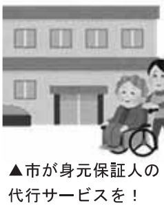
▲市が身元保証人の代行サービスを!

困難になります。認知症になつたら尚更です。一人暮らし等の方たちを対象とした身元引受人の代行サービスを行政が社会福祉協議会で行つてはいかがですか。 健康福祉部長 身寄りのない高齢者が今後増加していくことを考えると、自治体や公的組織も含めた新しい保証の在り方が必要であると認識しております。 議員 身元引受人も含め幅広く高齢者安心生活事業を行っている自治体もあります。当市での早急なる実現を要望します。