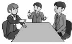
▲成長できる人材を

議員 当市の最上位計画である「ふるさと龍ヶ崎戦略プラン」を実現するためには、このプランのグランドコンセプトを明確にし、市民に分かりやすく伝えること、そして最終的には龍ヶ崎に住みたい、住んでいて良かったと思える市民が増える。つまり定住人口を増やしていくというランディングポイントが全職員に共有され、前向きに取り組める環境、その環境の中で成長できる人材をつくっていくかなければならないと考えます。この点について市長の見解をお伺いします。 市長 市民に市が何をしているのかを明確に示した上で、市の職員が意識を共有し事業を進め、市民の理解を得ていくことは大切であると認識しています。情報共有のネットワーク化しながら、縦軸・横軸で力強く事業を推進し、職員の資質の向上、それぞれの持つて いるスキルをアップしていくための努力も、大変重要なことだと思っています。市民の皆さんのご理解をいただき、市の職員の熱意を感じていただきながら、市のグランドコンセプトをわかりやすくお伝えしながら事業を進めていく。 これは議員ご指摘のとおり、このような形で政務をしていかなければならないと強く感じています。 議員 仕事柄、多くの企業をみていますが、トップ、つまり経営者の姿勢一つで企業は驚くほど変化します。当市のトップである市長の姿勢に今後期待しています。