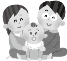
▲令和8年度より「こども未来部」が設置されました

◆議案第8号 龍ヶ崎市コミュニティセンターの設置及び管理に関する条例の一部を改正する条例について