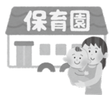
▲「こども誰でも通園制度」は、令和8年4月1日から本格的に開始しました

福祉部次長 通常保育が必要なお子さんが増えた場合には、こども誰でも通園制度の利用枠を減らし、通常保育を優先していくような形での運営を予定しております。