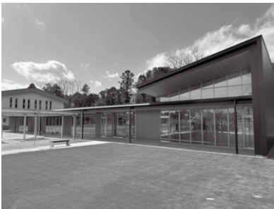
▲新長戸コミュニティセンターが、令和8年4月19日にオープンしました。多目的室や調理室、芝生広場などがあります

審議された主な議案の内容と、本会議で行われた議案に対する質疑や討論の一部について掲載しています。議案を所管する委員会においても、議案等の審査を行っており、その審査内容の一部を次ページに掲載しています。