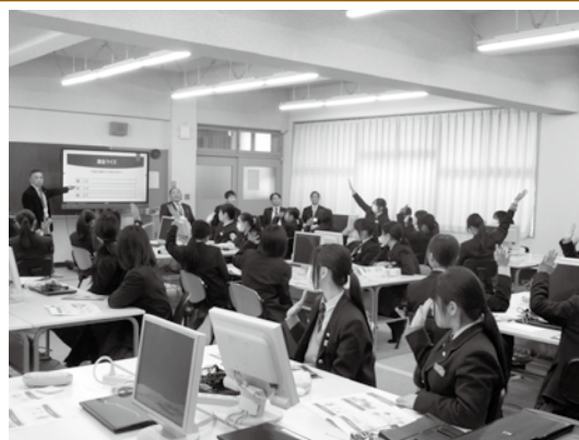
▲議会の仕組みや議員活動について説明した後、議会クイズを行い、楽しみながら理解を深めていただきました

若い世代ならではの視点から、まちに求める魅力や居心地の良さにつながる多くのヒントを得る、貴重な機会となりました。