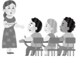
▲多文化共生を支える教育現場に対する支援を

教育監 担任等教職員個人の努力のみに委ねるのではなく、組織的な支援体制の下で対応し、持続可能な指導体制を構築しています。具体的には、