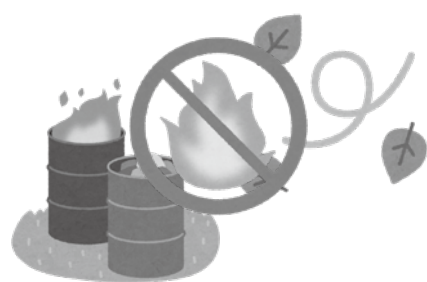
▲林野火災警報に従わなかった場合罰則を適用される可能性があります

また、注意報違反に対する罰則はありませんが、警報違反の場合は30万円以下の罰金または拘留となります。