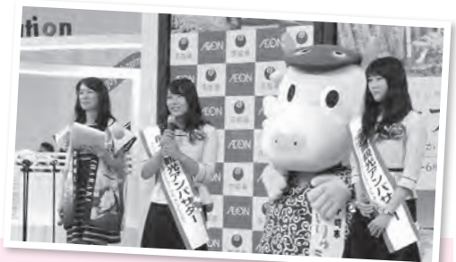
アンバサダーと龍ヶ崎をPRしてきたよ〜ん! ー茨城県フェア・イオンモールつくばー

このコーナーでは、街で見かけたまいりゅうの目撃情報や、あなたの撮ったまいりゅうの写真、まいりゅうのイラストなどを募集します。コメントを添えて、りゅうぼー編集室「まいりゅうを探せ」係 (☒ = koho@city.ryugasaki.ibaraki.jp) までお寄せください。