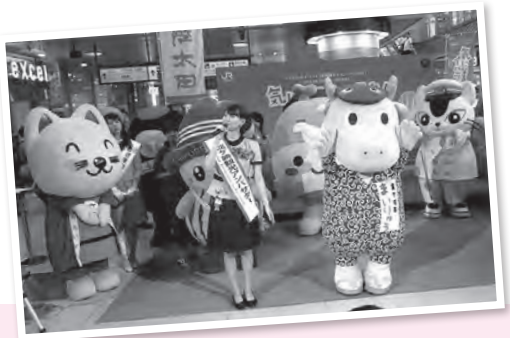
観光PRをしてきたよ〜ん! ーイバラキ夏季観光キャンペーン・水戸駅ー