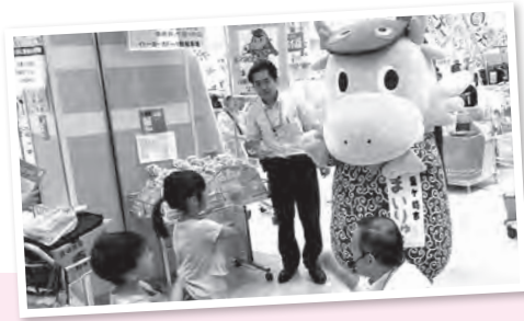
じゃんけんしてきたよ〜ん! ー茨城フェア・イトーヨーカドー竜ヶ崎店ー