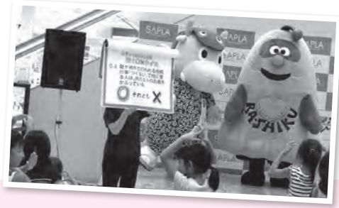
郷土〇×クイズ楽しかったよ〜ん! ー常陽小学生新聞郷土〇×クイズ・サブラー

このコーナーでは、街で見かけたまいりゅうの目撃情報や、あなたの撮ったまいりゅうの写真、まいりゅうのイラストなどを募集します。コメントを添えて、りゅうほー編集室「まいりゅうを探せ」係 (☒ = koho@city.ryugasaki.ibaraki.jp) までお寄せください。