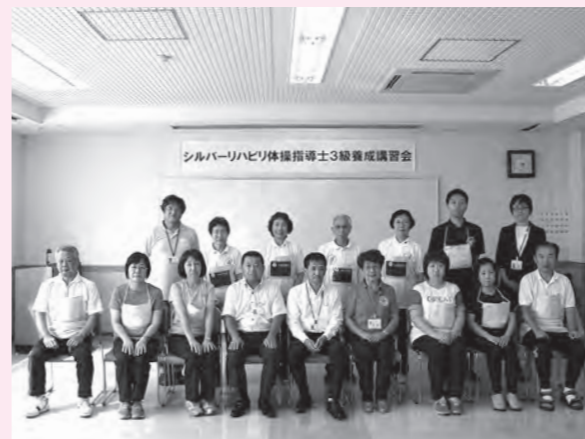
3級養成講習会を修了した6人（前列右端3人、左端3人）のシルバーリハビリ体操指導士の皆さん

このほど、茨城県立健康プラザと龍ヶ崎市の共催による「シルバーリハビリ体操指導士3級養成講習会」を修了した6人が、シルバーリハビリ体操指導士としての一歩を踏み出しました。