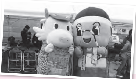
与一くんといっしょに楽しんだよ〜ん! -奥久慈太子まつり・太子町-

このコーナーでは、街で見かけたまいりゅうの目撃情報や、あなたの撮ったまいりゅうの写真、まいりゅうのイラストなどを募集します。コメントを添えて、りゅうぼー編集室「まいりゅうを探せ」係 (☒ = koho@city.ryugasaki.ibaraki.jp) までお寄せください。