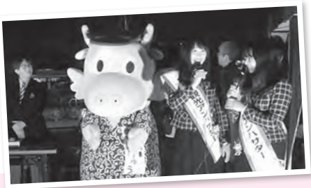
観光アンバサダーと点灯式に参加したよ〜ん! -イルミネーション点灯式・佐貴駅東口-